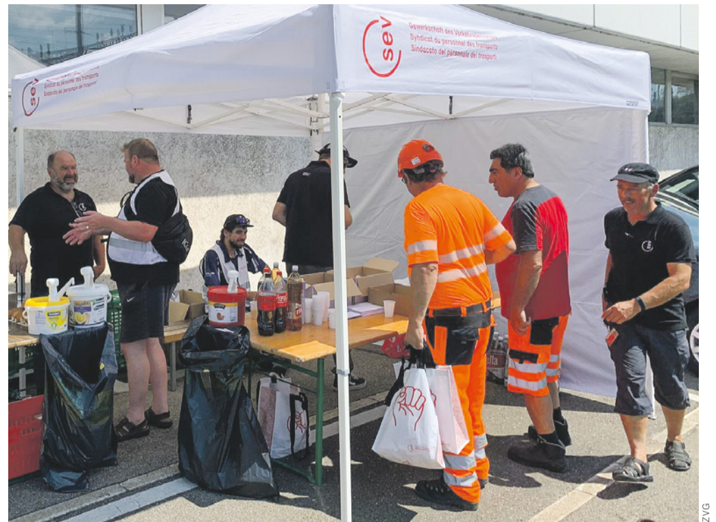
Die von den Sektionen RPV Basel, TS Nordwestschweiz und BAU Nordwestschweiz mit den Unterverbänden und dem Zentralsekretariat organisierte Hotdog-Aktion vom 16. August im RB MuttENZ war ein Erfolg: Die SEV-Präsenz vor Ort wurde von den Kolleg:innen sehr geschätzt.