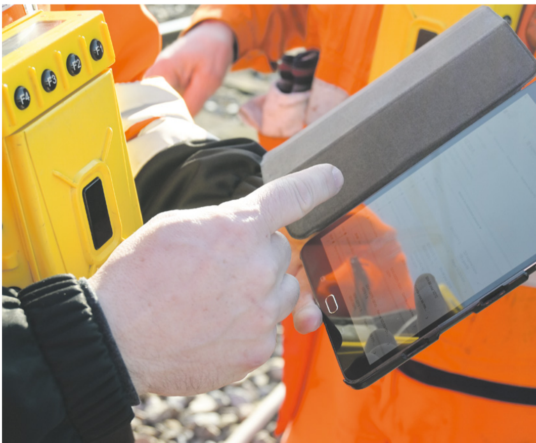
Die Digitalisierung hat weitreichende Auswirkungen auf unseren Arbeitsalltag.