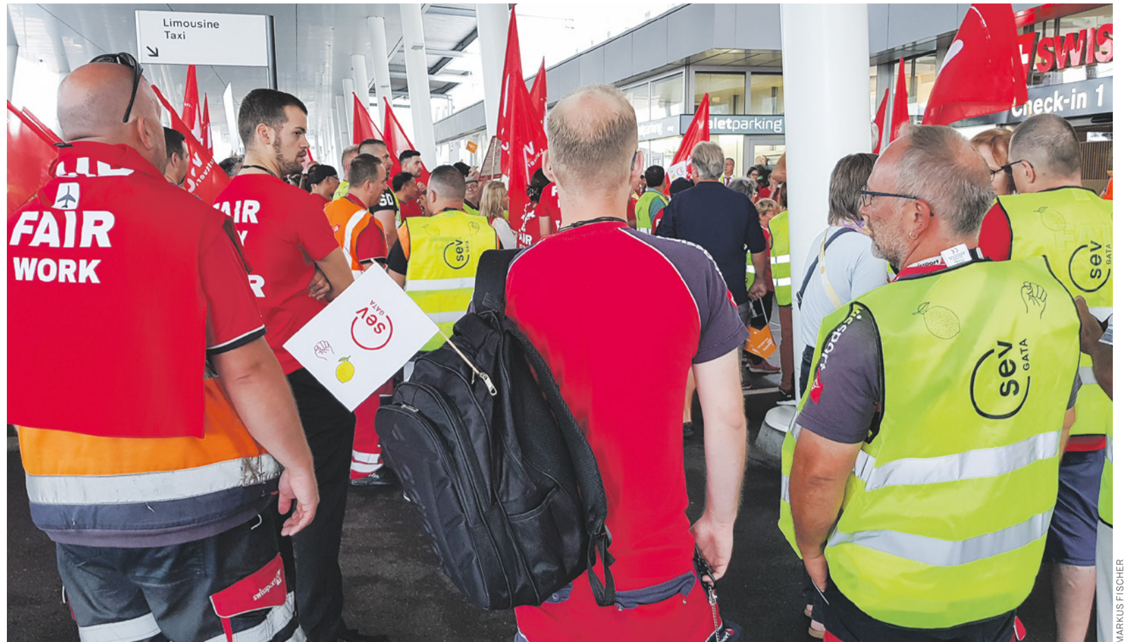
Über 200 Swissport-Mitarbeitende protestieren am 23. Juli am Flughafen Zürich lautstark und medienwirksam, ohne die Passagiere zu behelligen.

Fehlende Voraussicht, Unterbestände und mangelhafte Organisation: davon hat das Personal der Genfersee-Schiffahrt (CGN) die Nase voll, es ist müde und leidet. Am 29. Juni sprachen über 75 Mitarbeitende der Leitung einstimmig ihr Misstrauen aus, und der SEV schrieb der Leitung einen Brief. Dies beschleunigte die Durchführung eines externen Audits, dessen Ergebnisse im Herbst vorliegen sollen. Der Verwaltungsrat hörte am 7. Juli Mitarbeitende an. Die Leitung strich Charterfahrten und setzt Vorschläge zur Entspannung des Fahrplans um. Doch die Personalaufstockung muss rasch beginnen, denn für manche Funktionen dauert die Ausbildung viele Jahre.